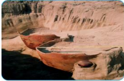
Mộ chum- đặc trưng của văn hoá Sa Huỳnh