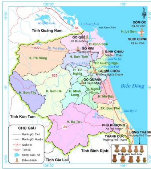
1.6. Lược đồ các di chỉ văn hoá Sa Huỳnh ở tỉnh Quảng Ngãi