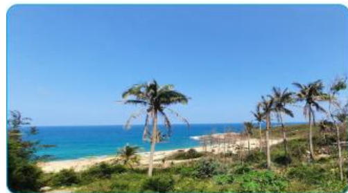
1.5 Lăng cổ Gò Cỏ bên bờ biển Sa Huỳnh (xã Phổ Thạnh, thị xã Đức Phổ) nơi lưu giữ những dấu tích của văn hoá Sa Huỳnh

+ Học sinh đọc thông tin, quan sát ảnh và trả lời