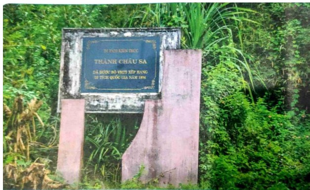
Di tích thành cổ Châu Sa ở thành phố Quảng Ngãi

+ Giáo viên yêu cầu học sinh đọc thông tin, quan sát hình ảnh, thảo luận với bạn bên cạnh , hãy trao đổi với bạn: