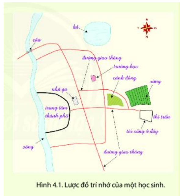
Hình 4.1. Lược đồ trí nhớ của một học sinh.