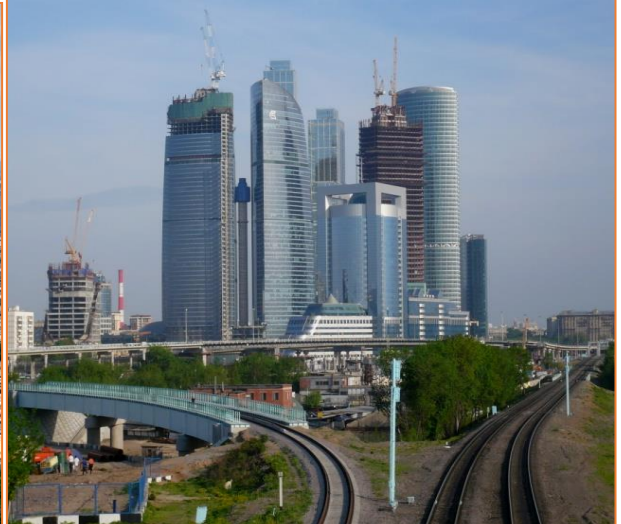
Thủ đô Mat-xco-va (Nga) 12,3 triệu người