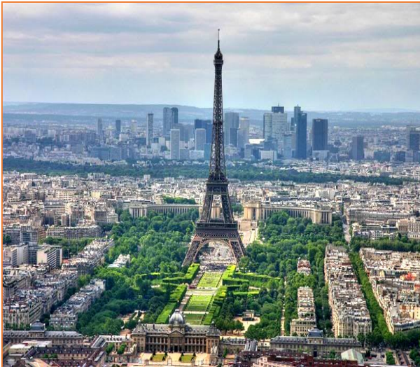
Thủ đô Pari (Pháp) 13 triệu người

Giáo viên cung cấp cho học sinh một số hình ảnh về các đô thị cụm đô thị đô thị vệ tinh ở châu Âu .