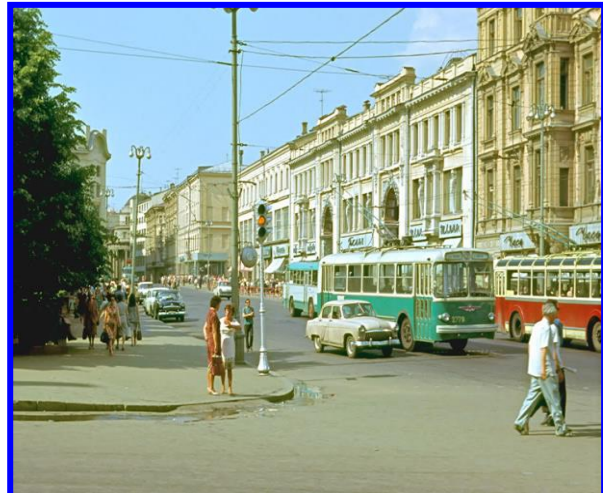
Thành phố Xanh pê-tec-bua 5,5 triệu người