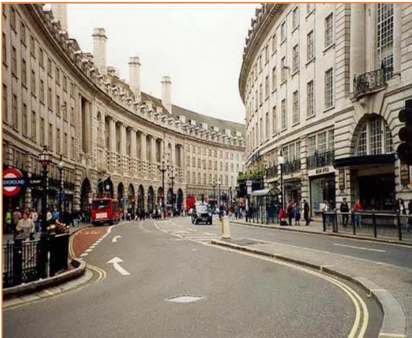
Thủ đô Luân Đôn (Anh) 8.6 triệu người