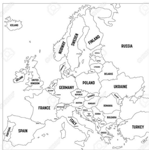
Liên minh Châu Âu đã phát triển như thế nào

+ Nhóm 5: tô màu Tím các nước gia nhập EU năm 2007 đến 2013 (kết nạp thêm 3 nước thành viên: Bugaria, Romania, Croatia)