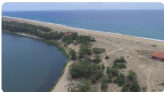
1.4 Một góc đầm An Khê (thị xã Đức Phổ) nơi đầu tiên phát hiện di chỉ văn hoá Sa Huỳnh