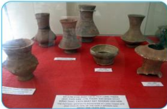
Đồ gốm khai quật tại di tích Long Thạnh- Đức Phổ năm 1978