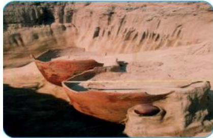
Mộ chum- đặc trưng của văn hoá Sa Huỳnh