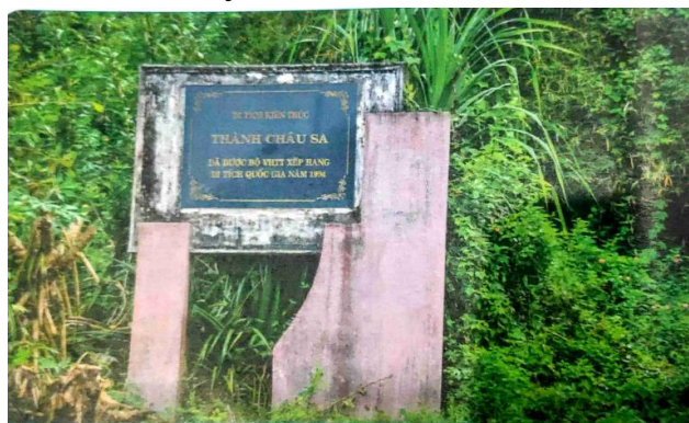
Di tích thành cổ Châu Sa ở thành phố Quảng Ngãi

+ Giáo viên yêu cầu học sinh đọc thông tin, quan sát hình ảnh, thảo luận với bạn bên cạnh, hãy trao đổi với bạn: