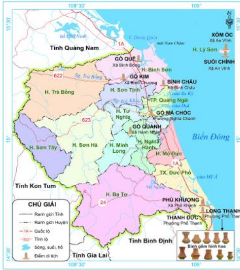
1.6) Lược đồ các di chỉ văn hoá Sa Huỳnh ở tỉnh Quảng Ngãi