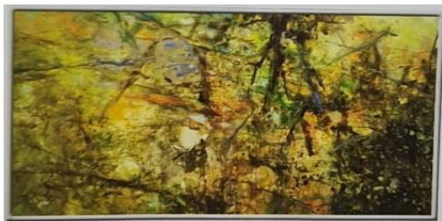
2. Pham An Hai, Dưới mặt nước, 2016, acrylic và sơn dầu, 100cm x 200cm.