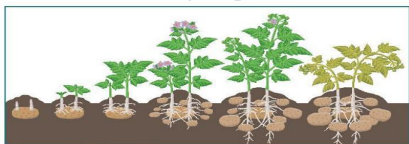
Hình 21.1 Sinh trưởng và phát triển ở cây khoai tây

Câu 2: Quan sát sự thay đổi hình thái của sinh vật trong các hình 21.1, 21.2, đọc thông tin trong mục II, nêu vai trò của trao đổi chất và chuyển hóa năng lượng đối với sinh trưởng và phát triển của khoai tây và con gà.