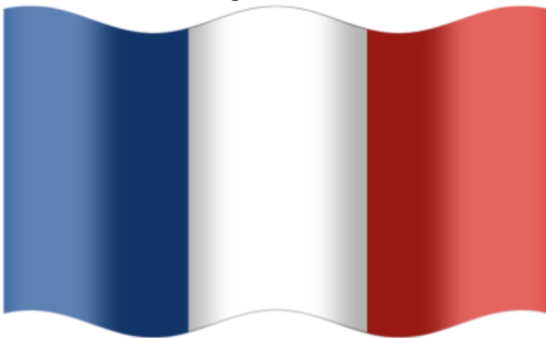
Quốc kỳ của nước Pháp