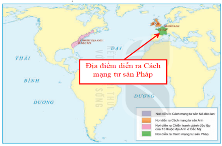
▲ Lược đồ nơi diễn ra một số cuộc cách mạng tư sản từ thế kỉ XVI - XVIII