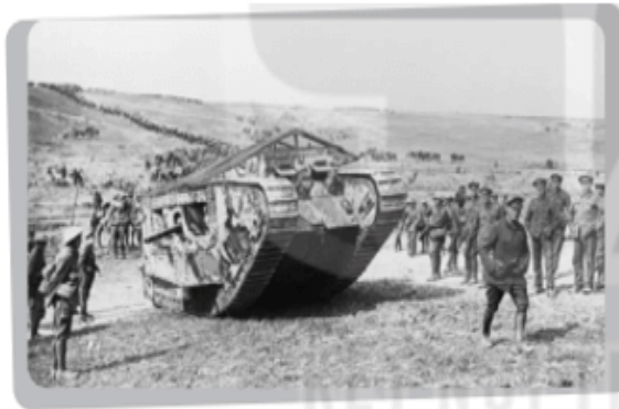
Hình 12.1. Xe tăng quân đội Anh tấn công quân Đức ngày 15 - 9 - 1916