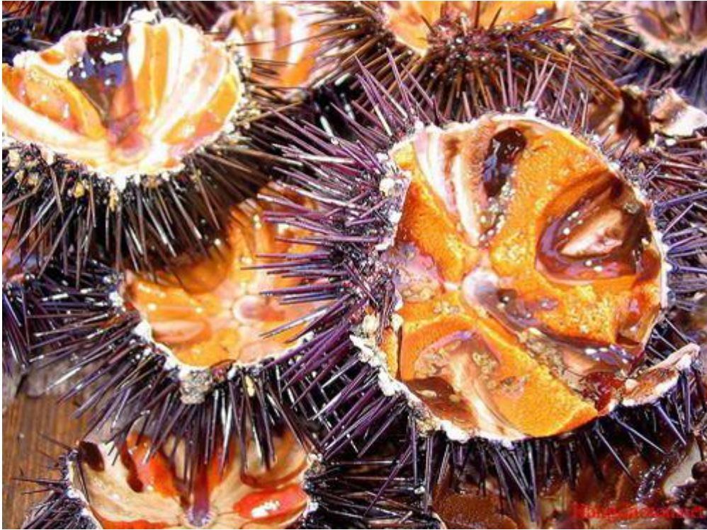
Mắm nhum đặc sản quý hiếm của Quảng Ngãi