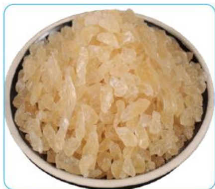
6.6 Đường phèn

+ Giáo viên yêu cầu học sinh tìm hiểu thông tin, quan sát tranh và trao đổi với bạn bên cạnh :