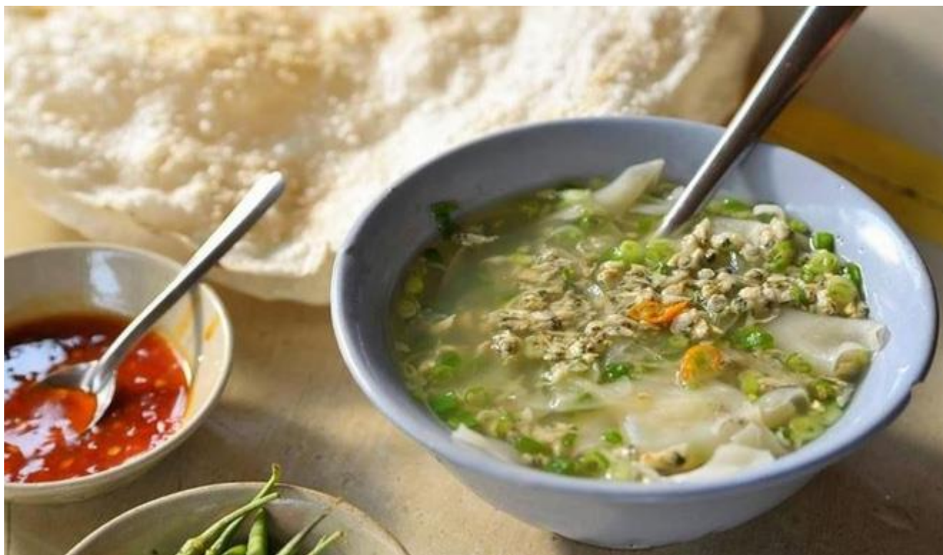
Don đặc sản nổi tiếng nhất Quảng Ngãi