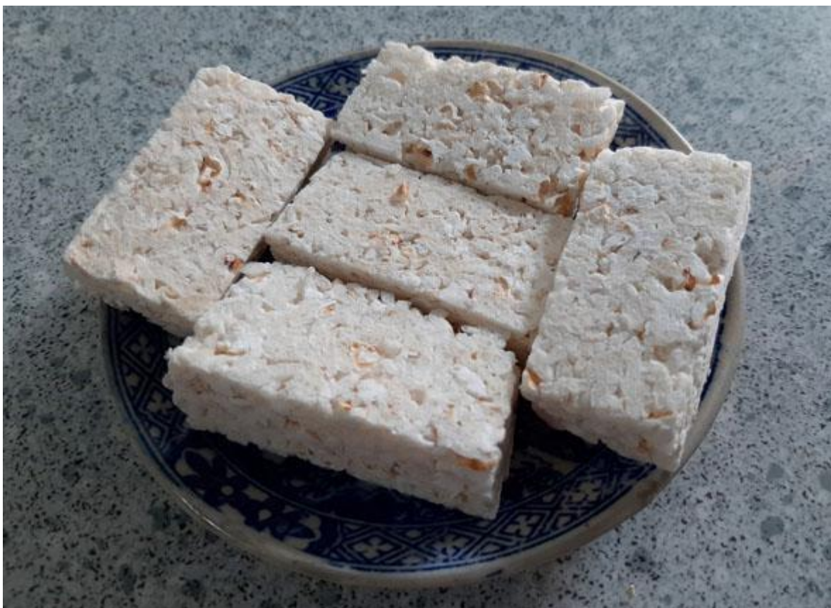
Bánh nỏ món tráng miệng tham đậm

Bánh nỏ là món ăn truyền thống của người dân Quảng Ngãi, được dùng để mời khách. Vì sao lại có tên là bánh nỏ? Bánh được tạo thành từ việc rang những hạt nếp trên than tạo ra những tiếng nổ, từ đây nó có tên là bánh nỏ. Công đoạn tiếp theo để làm bánh nỏ là thắng nước đường và gừng hòa tan trộn nếp rang vào là bạn đã có bánh nỏ. Khi ăn bạn sẽ cảm nhận được hương vị thơm của nếp, vị của gừng trên đầu lưỡi.