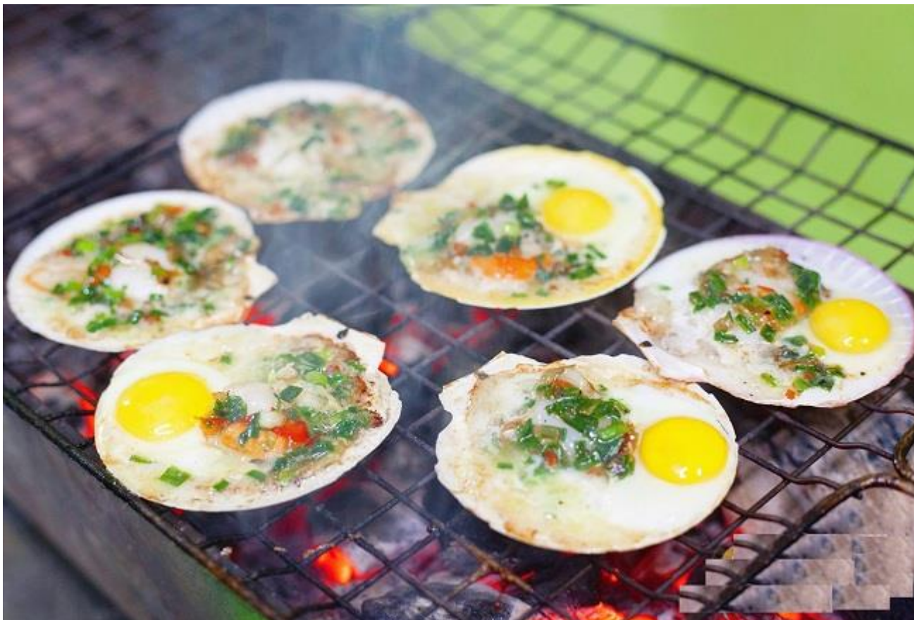
Sò điệp nướng thơm ngon hương vị biển

ngọt, béo ngậy làm say lòng thực khách. Vì đây là vùng biển nên hải sản tươi ngon mà lại rẻ nữa chỉ với 30.000đ là bạn đã có 1 đĩa sò điệp nướng hấp dẫn.