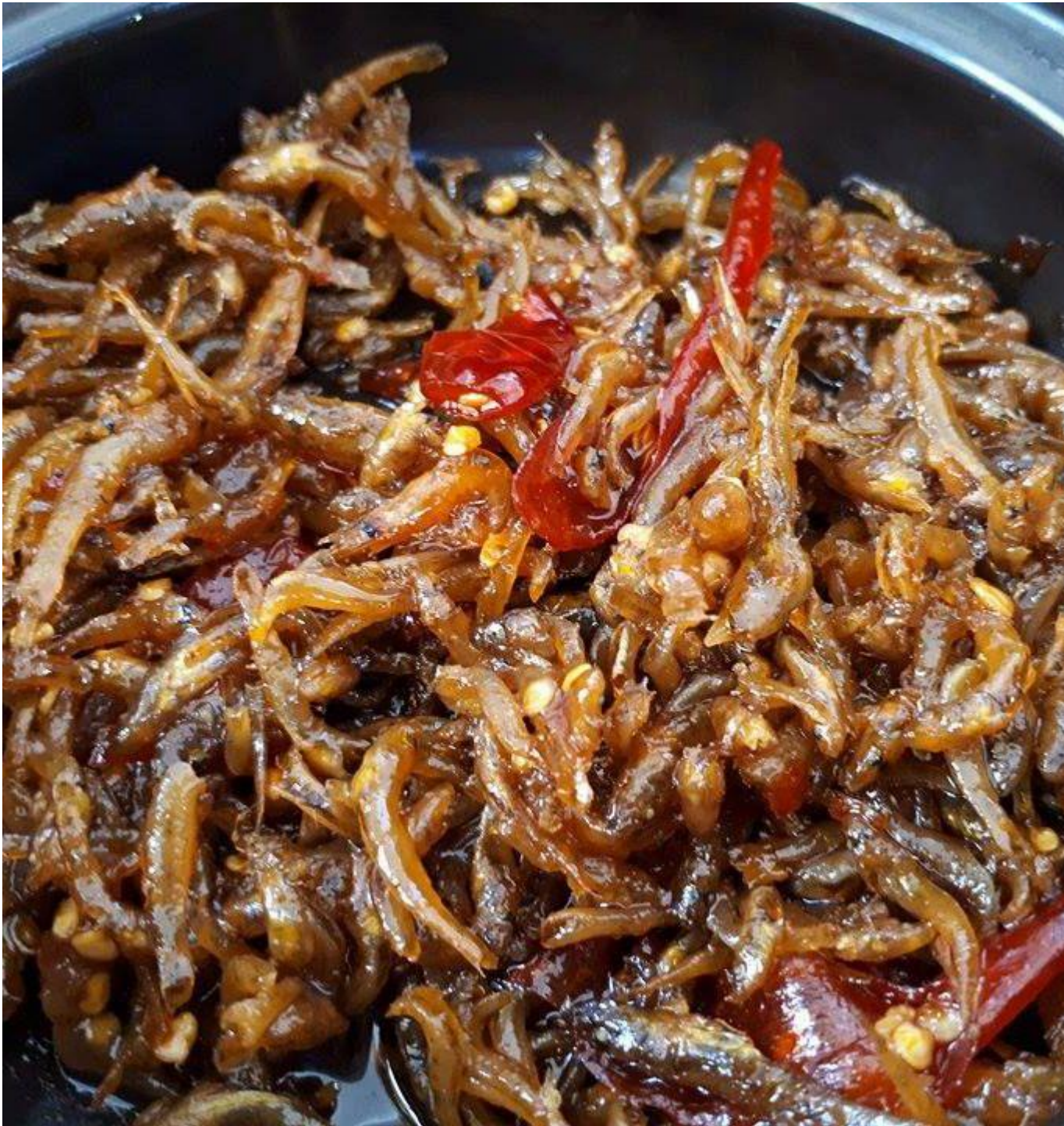
Cá bóng kho tiêu đặc sản quý gửi tặng người thân phương xa