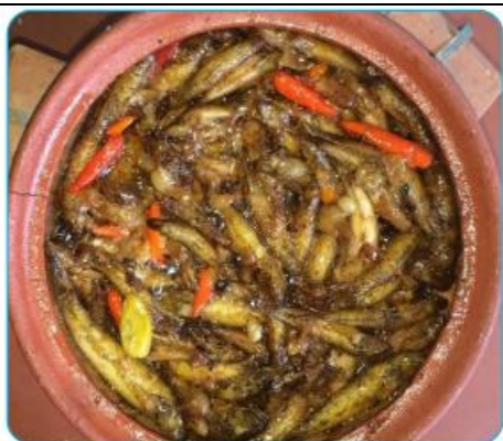
6.1 Cá bóng kho tiêu