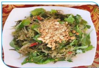
Gỏi bông bòng