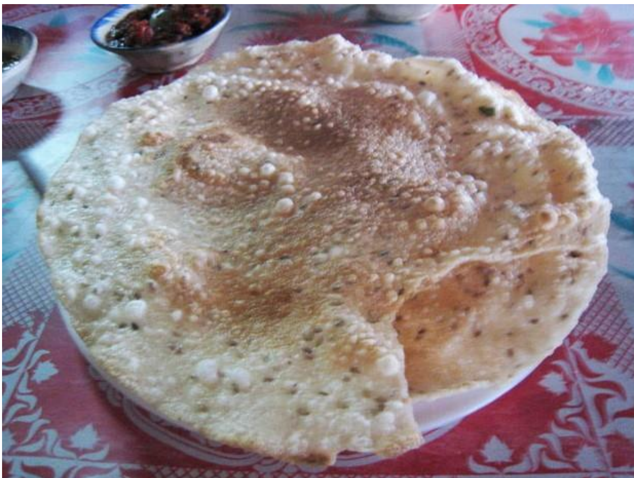
Bánh tráng được dùng rất nhiều trong ẩm thực Quảng Ngãi