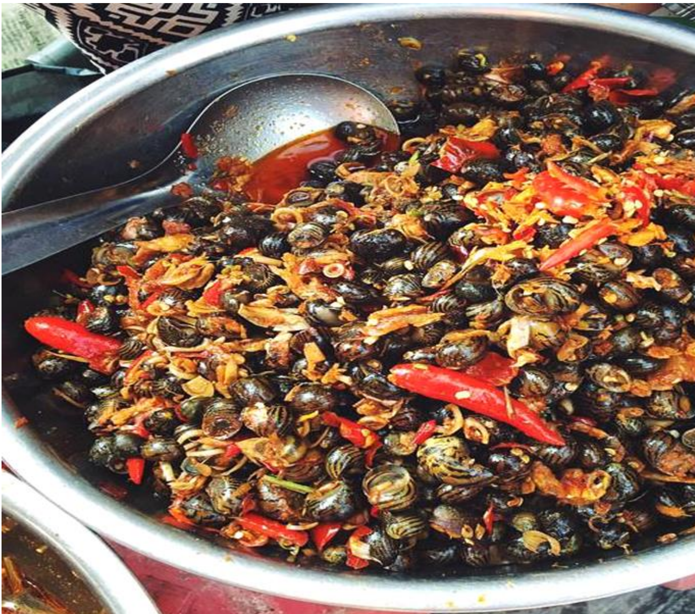
Ốc hút thơm ngon, cay nồng