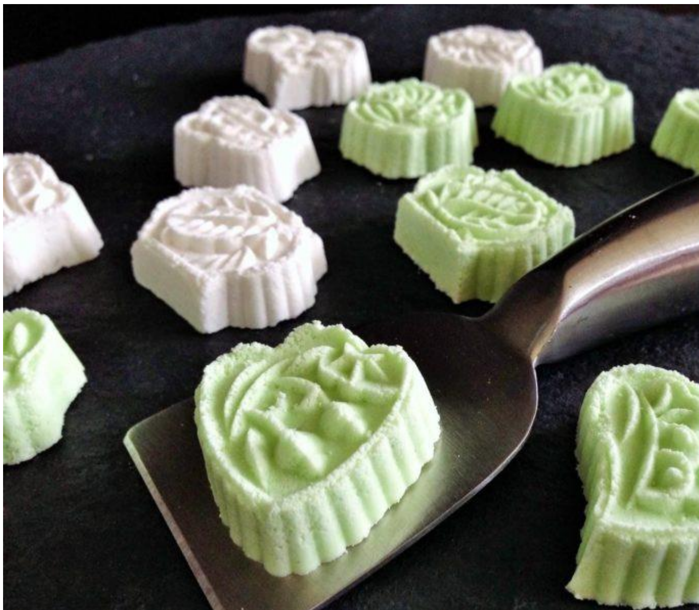
Bánh in đặc sản Quảng Ngãi