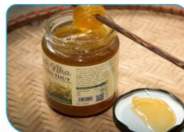
6.10 Mịch nha

- C2: Em hãy thu thập thông tin về những nguyên liệu cần thiết để chế biến kẹo gương và kẹo Cu đơ. Cách chế biến kẹo gương và kẹo Cu-đơ có gì khác nhau?