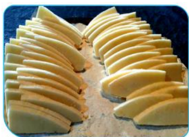
6.8 Đường phôi