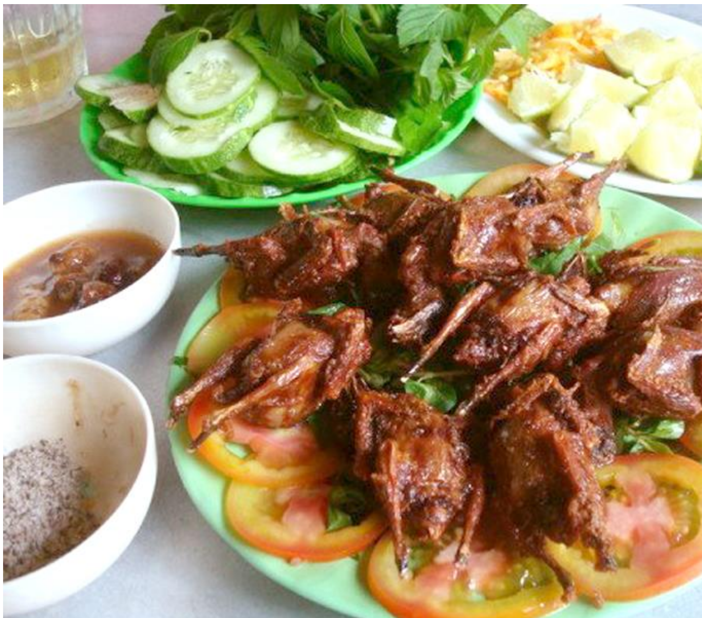
Chim mía nướng quà tặng từ thiên nhiên

mía ” ở các quán ăn ở nơi đây, chỉ với 100.000đ là bạn có thể tha hồ thưởng thức món chim mía Quảng Ngãi.