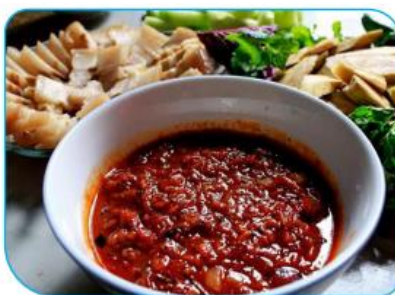
6.9 Mắm nhum