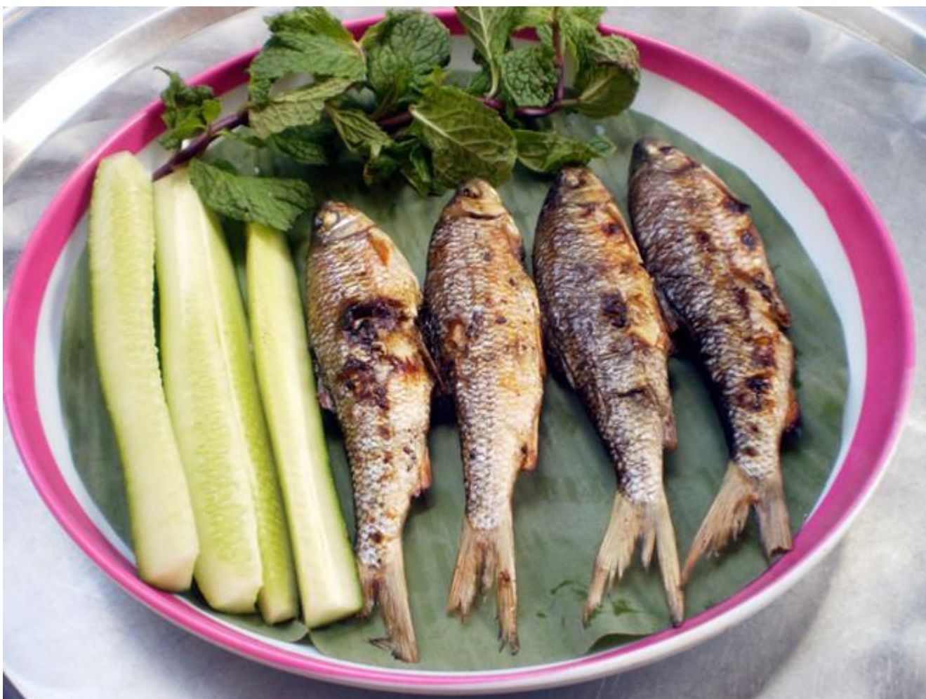
Cá niên nướng món ăn dân dã của người dân miền núi Quảng Ngãi

Cũng là một đặc sản ở Quảng Ngãi nhưng cá niên nướng lại xuất hiện ở miền núi Trà Bồng, Sơn Hà, Sơn Tây... Nếu có dịp ghé qua nơi này vào dịp xuân sang đừng bỏ qua món ngon vật lạ ở nơi này bạn nhé! Vì sao mình lại nói vào dịp xuân sang vì đây là thời điểm cá niên sinh sản. Bạn có thể kết hợp đi du xuân cùng với thưởng thức ẩm thực cho chuyên du lịch thêm phần hấp dẫn. Cách chế biến cá niên nướng rất đơn giản bạn chỉ cần xiên cá vào cây đũa rồi nướng, điểm đặc biệt cá niên là không cần làm ruột cá vì ruột cá rất ngon và hấp dẫn. Cá niên quý, ngon thực phẩm tự nhiên nên hơi đắt bạn nhé giá giao động 300.000đ/ kg.