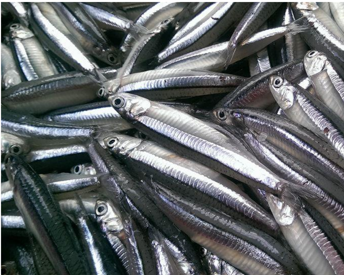
Cá cơm kho ngon ngắt ngay